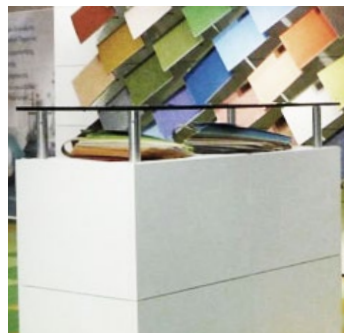
Leichtbauplatten CONCEPT 500x400mm Lightweight CONCEPT 500x400mm

Lightweight paper honeycomb middle layer