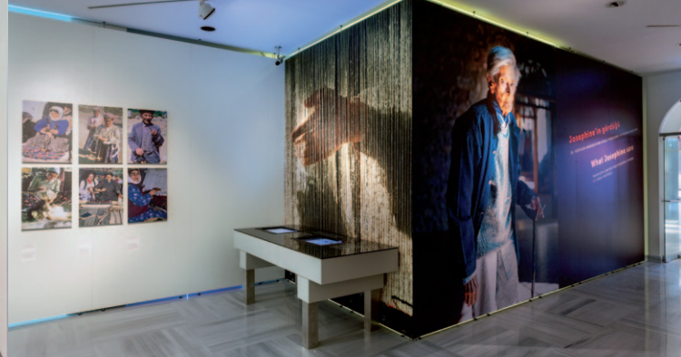
G40 Wandelemente, Museum, Istanbul G40 wall panels, museum, Istanbul