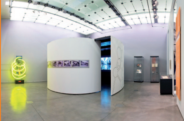
G40 Wandelemente und Rundwände für Museum, Luxemburg G40 wall panels and curved wall for museums, Luxemburg