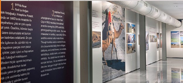
Leichtbauwandsystem G40 im Ausstellungsraum Lightweight construction wall system G40 in Show Room