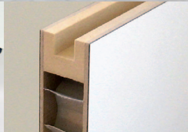
Papierwabenmittellage Honeycomb Design